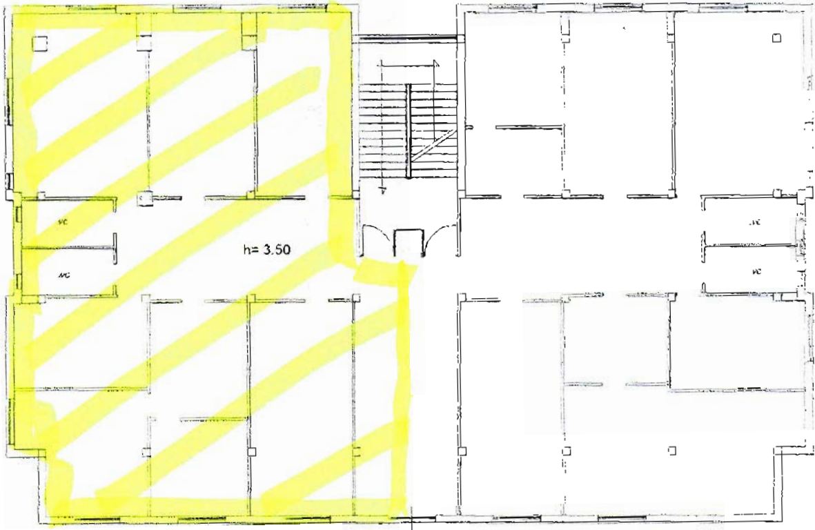
Piano Primo Sottostrada